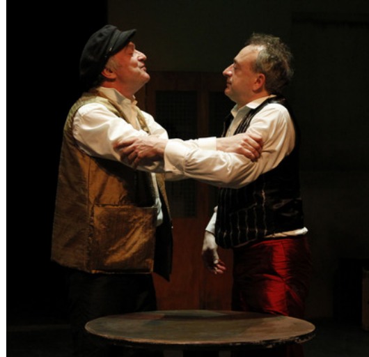
Сцены из «Мёртвых душ».