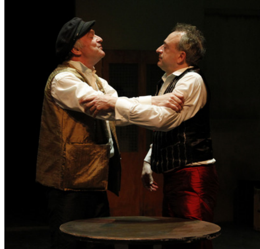
Сцены из «Мёртвых душ».