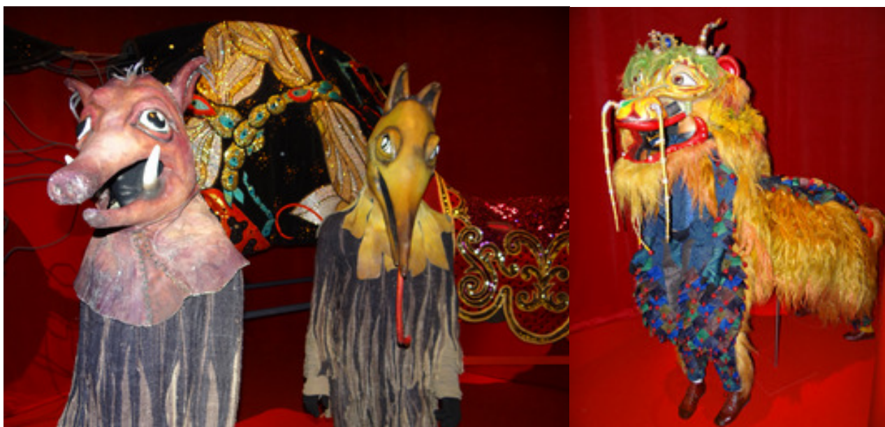
Костюмы животных в экспозиции «Большого парада»

Благодаря сотрудничеству CNCS и Fage Editions, к открытию выставки издан прекрасный каталог-альбом, автор - Паскаль Жакоб. Увлекательно написанный, по-французски, текст обильно иллюстрирован фотографиями.