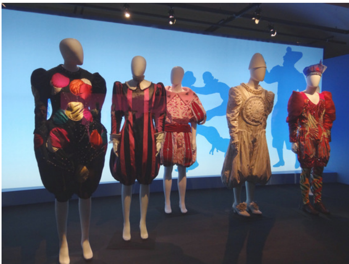
Фрагмент витрины, посвященной костюмам клоунов

Для ознакомления публики с коллекцией в залах CNCS периодически проводятся тематические выставки. За семь лет существования этого музея здесь были развернуты 15 экспозиций, среди них - «Костюмы Кристиана Лакруа» (2007), «Жан-Поль Готье - Режи́н Шопино: Дефиле» (2007), «Костюмы «Тысячи и одной ночи» (2008), «Рудольф Нуреев, жизненные вехи» (2009), «Русские оперы начала Русских балетных сезонов» (2009- 2010), «Наряды дивы» (2010), «Позади декораций в Comédie Française и Парижской опере в XIX веке» (2012), «Кристиан Лакруа, «Ручей» - балет Парижской оперы» (2012).