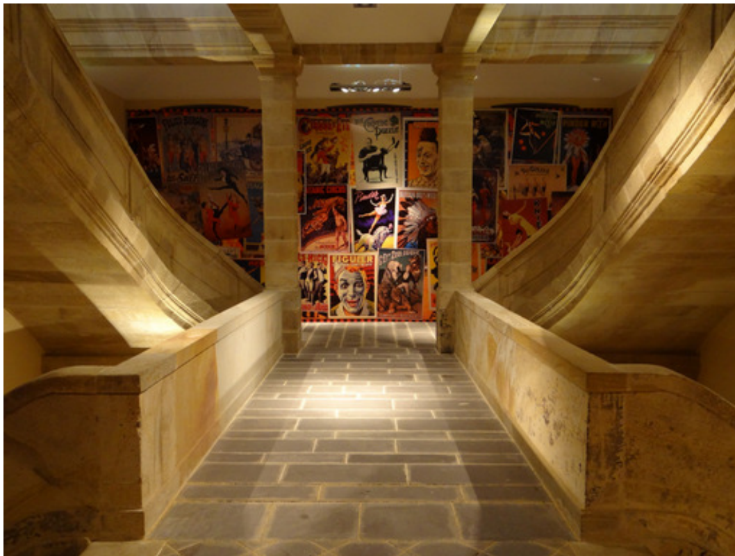
Главная лестница CNCS

В нынешнем году 18 октября в CNCS состоится открытие первого и единственного в Европе музея Рудольфа Нуреева.