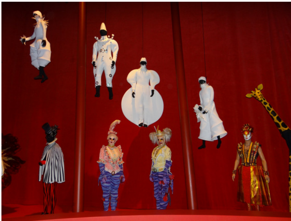
Фрагмент экспозиции «Большого парада» в зале №13

Каждый из восьми больших залов имеет собственную тематику, соответствующую одному из многих жанров циркового искусства. Есть также четыре небольших зала, посвященные аксессуарам, эскизам для изготовления костюмов, театральным сундукам и артистическим ложам. В больших залах основу экспозиции составляют цирковые костюмы. Все они одеты на точно сделанные под их размер черные бархатные манекены, эффектно размещенные в огромных горизонтально растянутых витринах. Благодаря искусной подсветке, костюмы как бы оживают и участвуют в цирковых номерах, персонажи которых нарисованы на светящихся задниках каждой витрины. В каждом зале есть историко-литературный текст, посвященный конкретному цирковому жанру или теме, представленной в экспозиции. Тексты написаны на темных стенах, но их оживляют необычайно красивые росписи, а на вмонтированных телеэкранах транслируют видеоматериалы.