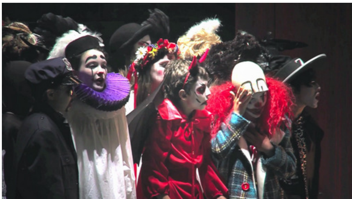
Задорная толпа уличных мальчишек

Находясь на гребне ныне модного направления по оригинальному переосмыслению популярных оперных шедевров, Оливье Пи, как всегда, одержимо взялся за постановку «Кармен». С предельной и рискованной смелостью режиссер перенес действие оперы из жаркой Сицилии XIX века в «теплое» кабаре Парижа XX века, где теперь и разворачивается трагическая история пламенной любви Кармен и Дона Хозе.