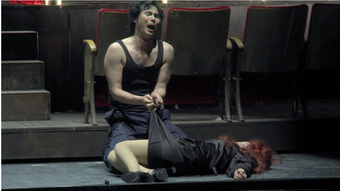
Хозе (Й. Ли) возле умирающей Кармен (Ж.М. Ло Монако)

Музыка Бизе завораживает мелодическим богатством, психологической глубиной и драматической выразительностью. К сожалению, оркестр Лионской оперы не смог передать всей поэтической красочности и эмоциональной силы партитуры «Кармен». В оркестре играют высокопрофессиональные музыканты. В чем же причина?