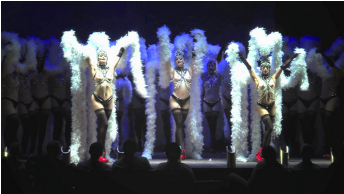
Пикантный номер в кабаре

На открытой сцене высится здание кабаре; при его вращении вокруг своей оси становятся видимыми разные интерьеры. Это фасад кабаре с горящим неоновым названием «Paradis perdu» (Потерянный рай), высокая рама с красным бархатным занавесом над сценической площадкой в окружении зрительских кресел, три этажа гримерных и костюмерных комнат, интерьер бара, наконец, пространство за кулисами и позади сценической площадки.