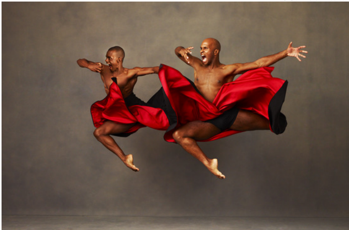
Дуэт из пьесы «The Hunt»

Вторым номером в программе шло нежное чувственное соло «Journey» (1958) в хореографии Джойс Трислер на музыку оркестровой поэмы Шарля Ивеса: танцовщица пленяла легкими вращениями и глубокими прогибами гибкого парящего тела. Потрясающий успех имела широко известная 32-