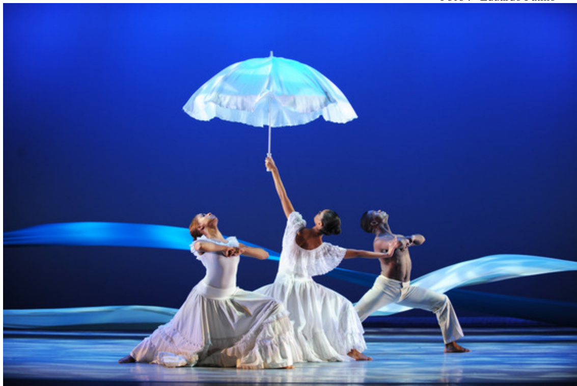
«Revelations» : свадебное шествие

Программа вечера шла по нарастающей; последним был показан главный балет А.Эйли - «Revelations» (Откровения). В этой постановке 29-летний хореограф гениально выразил глубокие переживания, пришедшие из воспоминаний о баптистских службах, которые он регулярно посещал с семьей в детстве. В 40-минутном балете звучат 10 народных песен, разных по содержанию, настроению и ритмике. Негритянские песнопения, грустные и радостные, ностальгические и праздничные, обретают на сцене образные танцевальные формы, поразительно яркие по лексике и необычайно выразительные по стилю. В экспрессивных хореографических картинах предстают моменты глубокой скорби, тяготы жизни, озорного веселья, свадебного шествия и, наконец, лихого праздника, который своей огненной экспрессией моментально захватывает всех зрителей в зале.