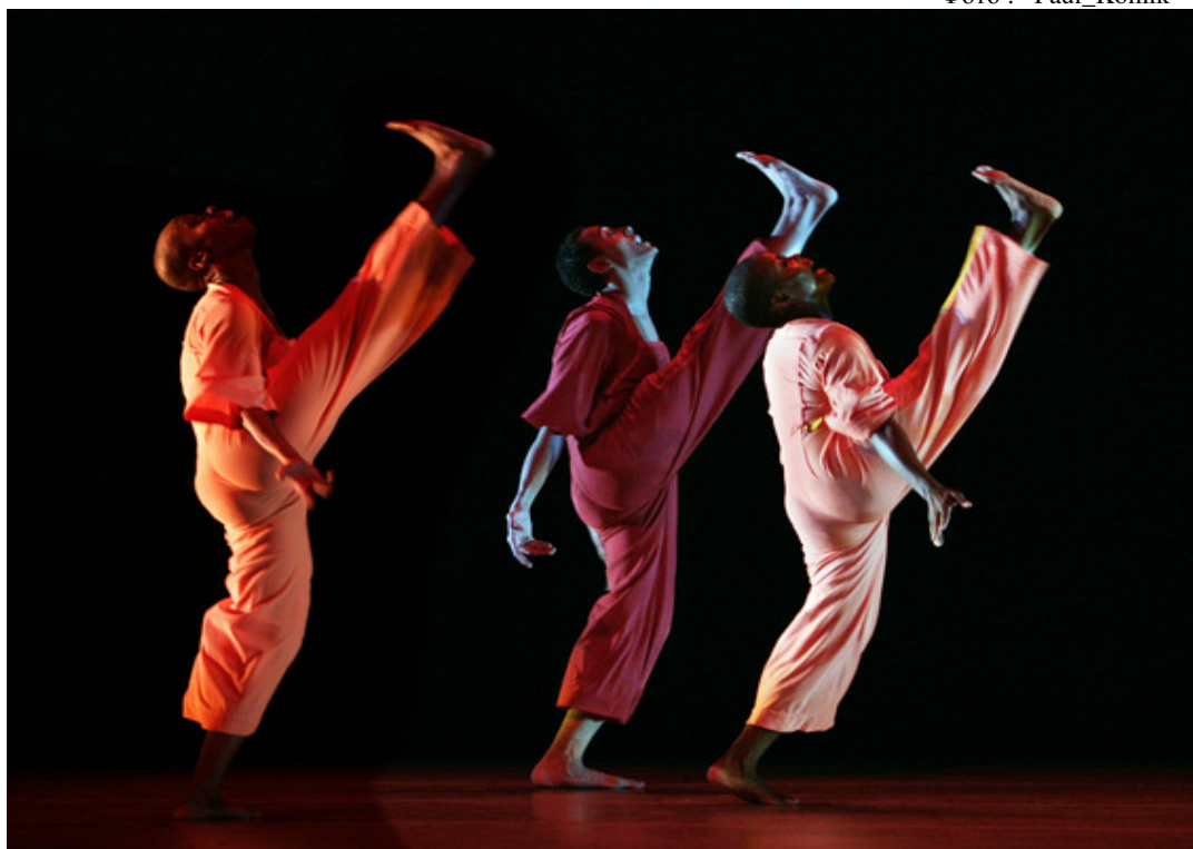
Фрагмент из пьесы «Love Stories»

Затем была показана знаменитая пьеса О.Нахарина «Minus 16», выстроенная контрастно и эффектно на музыке разных композиторов, в частности Вивальди (Nisi Dominus) и Дика Дале (Hava Nagila), а также на мотивах еврейских народных песен. Композиция включает фрагменты предыдущих постановок О.Нахарина, «смутьяна еврейского танца», как часто называют хореографа.