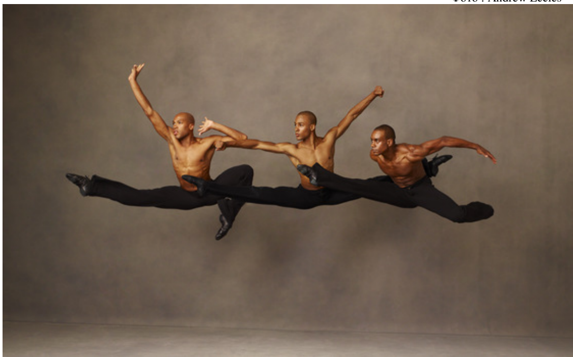
Трио из балета «Revelations»

После смерти А.Эйли в течение 22-х лет (1989-2010) AAADT и школу танца, основанную при театре в 1969 году, возглавляла Джудит Джеймисон, обворожительная танцовщица, ставшая интересным хореографом. Создав ряд постановок для AAADT, она сохранила хореографическое наследие А.Эйли и продолжила его артистическую политику - направленную на развитие американского танца модерн, на расширение его лексики и репертуара, -