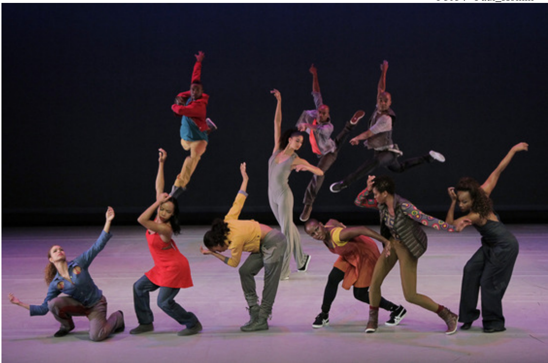
«Home» : финал

В три субботних дня труппа (30 высокопрофессиональных артистов, 13 из которых были ангажированы в 2009 году) давала по два представления - днем (15 час.) и вечером (20 час.). В последний день фестиваля (21 июля) две