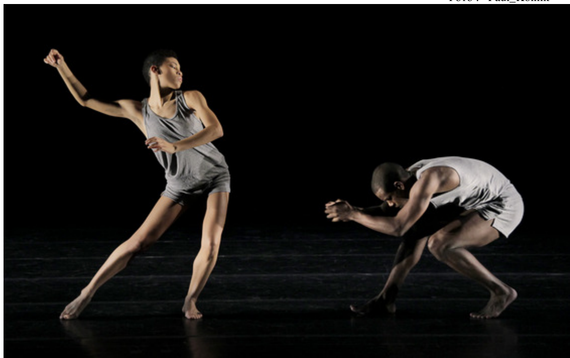
Дуэт из композиции «Minus 16»

Мне довелось не раз видеть эту постановку О.Нахарина: в «народном шоу» Звездами всегда были разные зрительницы. В заключительный вечер гастролей в Париже на сцену была приглашена, в качестве Звезды, именно та «дама», которую я случайно встретил у театральной кассы перед началом спектакля. Оценив стройную фигуру, искусный макияж незнакомки в длинном белом атласном платье, я не мог удержаться от комплимента - «Вы очень элегантны!» В ответ последовало - «Мерси», крепким мужским басом: это был травести!