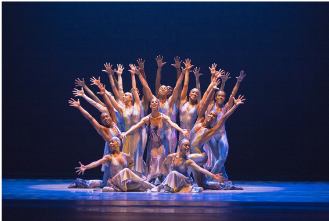
«Night Creature»: финал

Музыкальность, энергия, страсть и красота в сочетании с феноменальной техникой и редкостным артистизмом, совершенством и органичностью танцовщиков в разных хореографических стилях вознесли труппу AAADT на столь высокий мировой уровень, что даже взыскательный А.Эйли был бы восхищен! Нынешний триумф в Париже стал новой страницей в истории легендарной труппы, которая в каждом представлении передает свой мощный заряд энергии публике, делая и ее тоже молодой и счастливой!