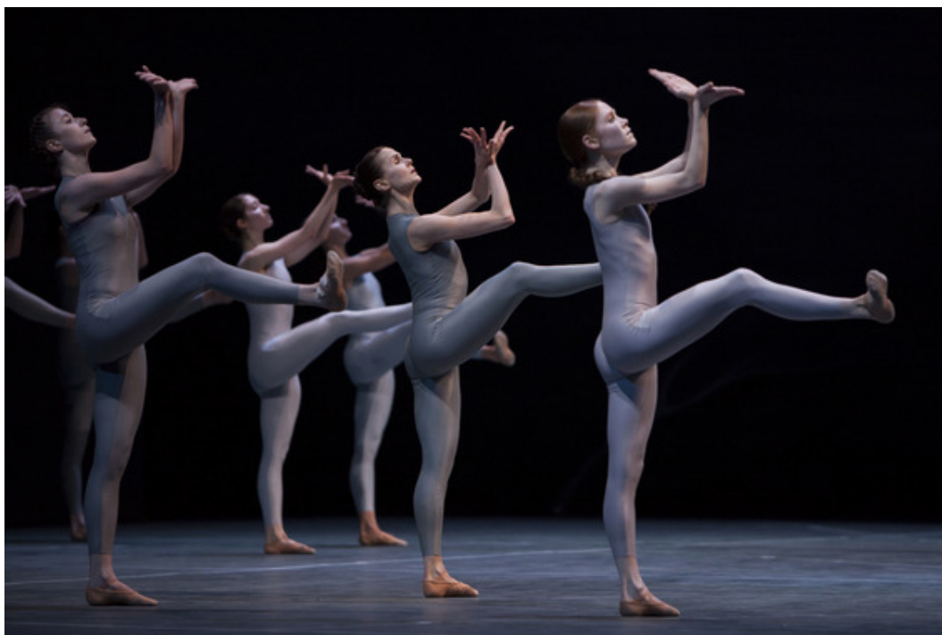
. Женский ансамбль в балете «Весна священная»

По периметру сумрачной сцены высится триптих темного задника; на центральном его фронте постепенно возникает размытое пятно слабого предрассветного свечения. Все 30 исполнителей балета выглядят как однополюсные существа: они одеты в невзрачные одноцветные облегающие комбинезоны, более светлой гаммы - для женской группы.