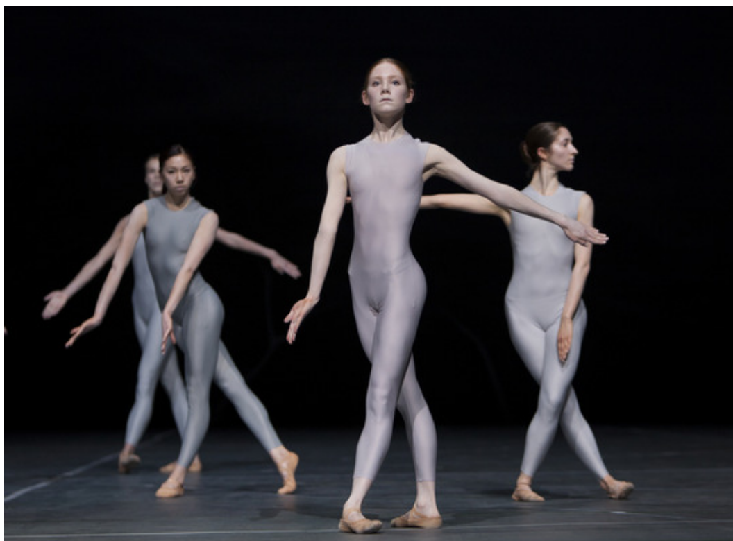
Женское трио балете «Весна священная»

Ш.Вей издавна влюблен в музыку «Весны священной». «В ней заключена такая мистерия и сконцентрировано такое напряжение, что ее можно слушать бесконечно» - говорит хореограф. В 2003 году он уже успешно поставил этот балет в своей труппе, но под музыку И.Стравинского для фортепьяно в четыре руки. Теперь, 10 лет спустя, предстояло воплотить оркестровую версию знаменитого шедевра. «В этой музыке чувствуется бешенная энергия и бешенная драма. Не удивительно, что 100 спустя после ее сочинения люди так ею заморожены».