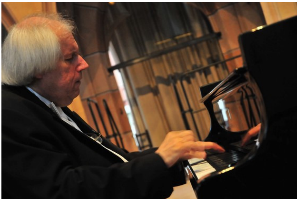
Григорий Соколов играет сольный концерт в церкви Святого Матфея