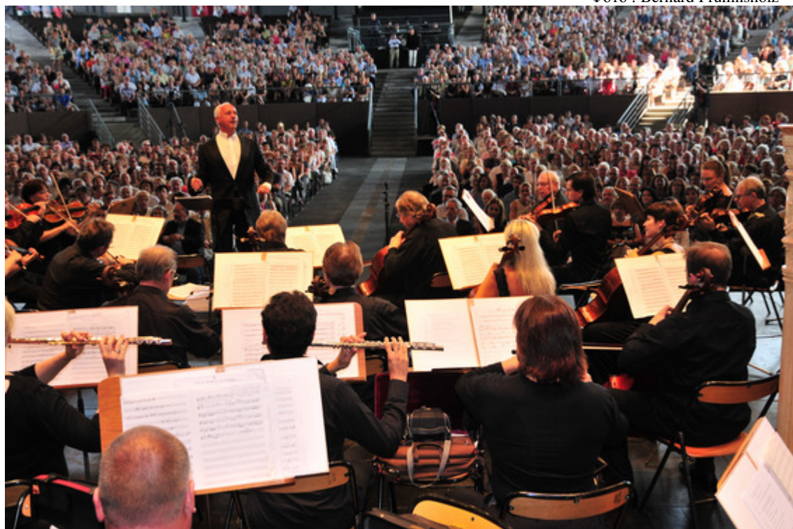
Владимир Спиваков и Национальный филармонический оркестр России на заключительном гала-концерте