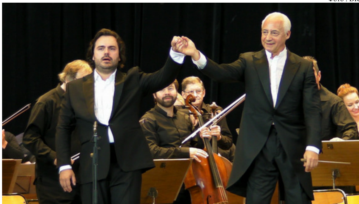
Василий Ладюк и Владимир Спиваков на заключительном гала- концерте