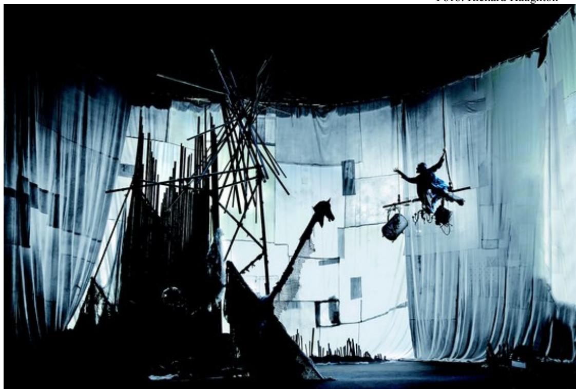
Джеймс Тьере в спектакле «Рауль»