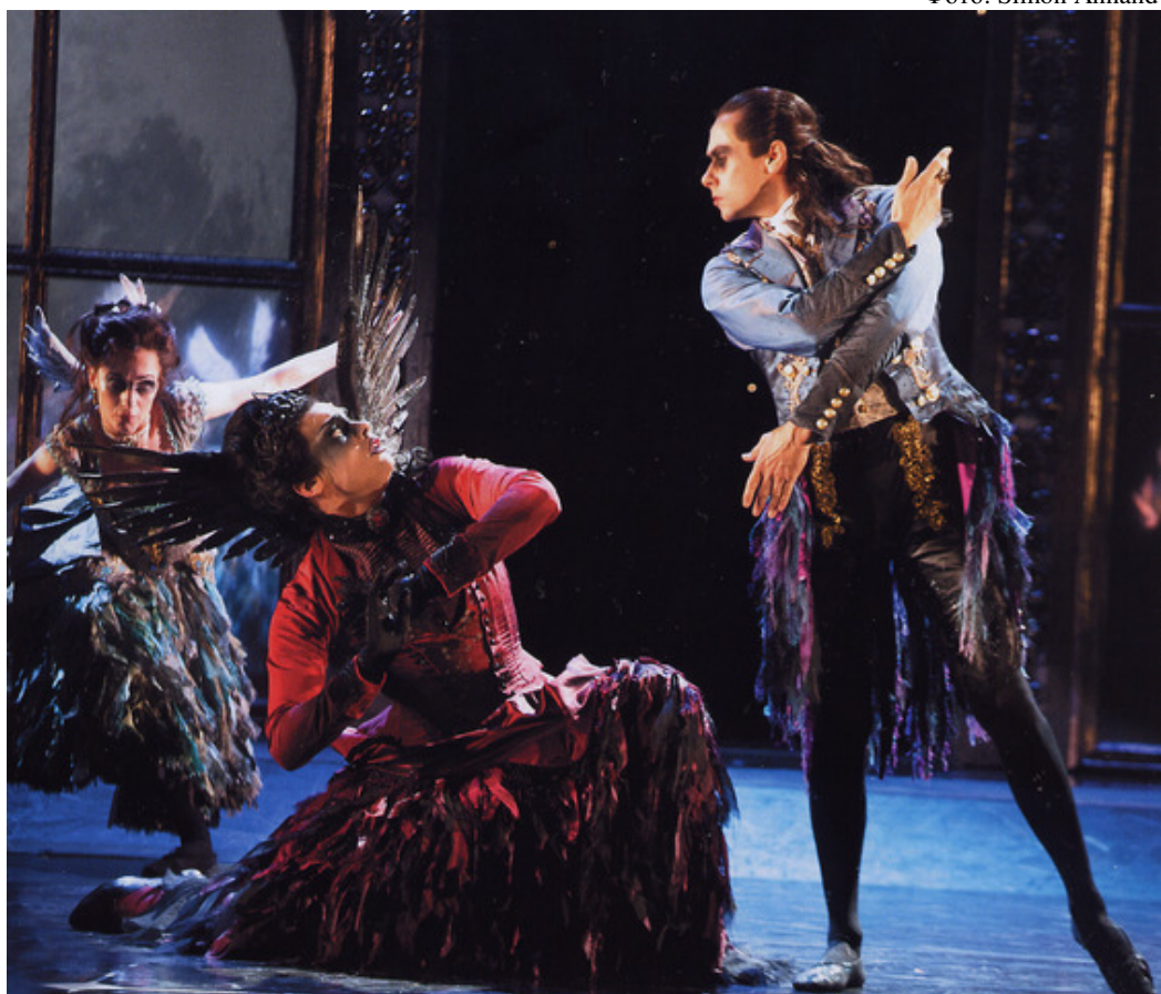
Сцена из балета «Спящая красавица» в постановке Мэтью Боурна (Великобритания)

Французская труппа Орлеанского национального хореографического центра исполнит пьесу «Sho-bo-gen-zo» в постановке Жозефа Наджа (18-21 июня). Известная французская балерина Сильви Гилем продемонстрирует свое высокое искусство в чрезвычайно интересной программе «За 6000 миль» (19-25 июня). Гилем выступит в двух последних из трех пьес - «27'52''», «Reagrau» и «Vue», соответственно, в хореографии Иржи Килиана, Уильяма Форсайта и Матса Эка.