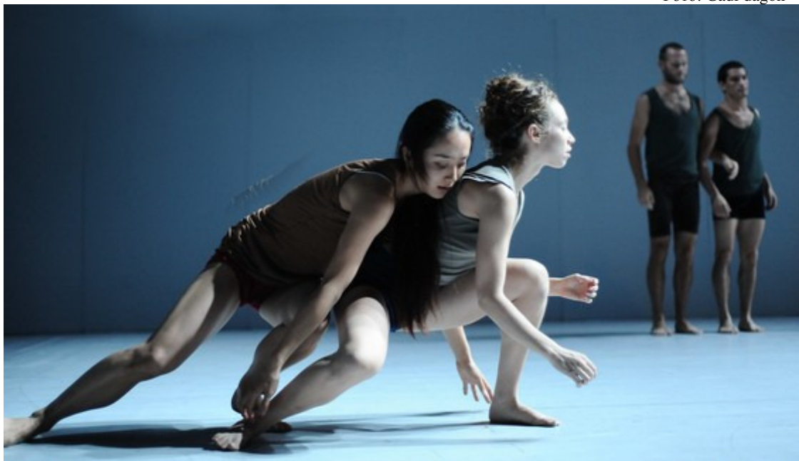
Фрагмент опуса «Sadeh21» в хореографии Охада Наарина (Израиль)

Программа мировая серия включает 19 спектаклей (21 произведение) в постановке двадцати известных мастеров. На пяти московских площадках спектакли исполняют 18 трупп из 12 стран. Эта серия необычайно богата танцевальными постановками: добрую ее половину занимает пластический театр, что связано с активным внедрением в него режиссерских идей и новаций.