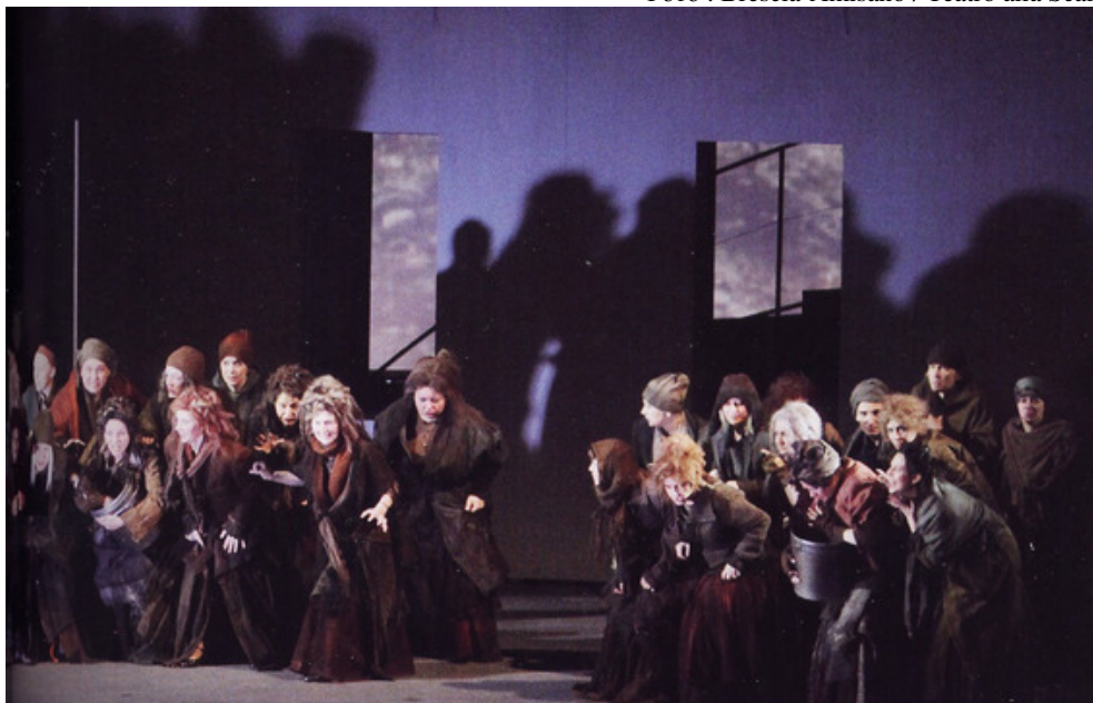
Сцена с участием ведьм в III акте