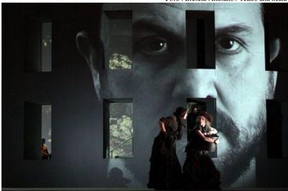
Пролог спектакля с плюшевым медведем