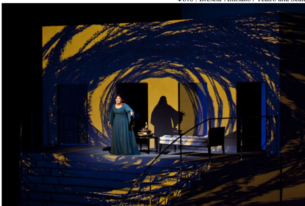
Каватина леди Макбет (Л.Гарсия) в I акте