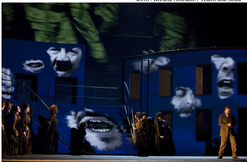
Сцена из III акта