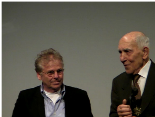
Стефан Эссель и Даниэль Кон-Бендит

Но, конечно, гвоздь программы – Даниэль Кон-Бендит. Как всегда обаятельный и харизматичный, бывший лидер студенческих волнений 60-х, а сегодня евродепутат от