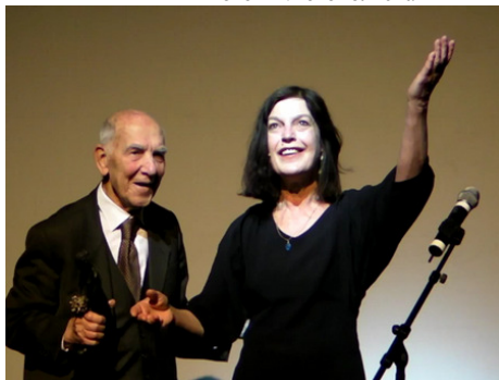
Стефан Эссель и Ангела Винклер

Третий лауреат, Эссель - бывший участник французского движения Сопротивления, чудом спасенный в Бухенвальде благодаря помощи немецких заключенных, после войны один из создателей Всеобщей декларации прав человека ООН, крупный дипломат, наконец, автор эссе «Возмущайтесь!», маленькой книжечки, которая разошлась миллионным тиражом по всей Европе и переведена на 40 языков мира. В этой книге-манифесте Эссель призывает современников, опираясь на собственный опыт Сопротивления: не будьте безразличны к окружающей вас несправедливости, действуйте!. «Давайте поверим в наши возможности изменить то, что плохо, и смело обозначим проблемы», - пишет Эссель, призывая людей к ненасильственным протестам против несправедливого устройства мира, так как никогда еще «власть денег не была такой мощной, нахальной и эгоистичной», как в сегодняшнем мире. В свои 94 года все еще на удивление подвижный, остроумный, артистичный Стефан Эссель с невероятной легкостью взлетел на сцену под руку с Даниэлем Кон-Бендитом. А потом с невероятным, хочется сказать юношеским, задором читал стихи Аполлинера, Гельдерлина, Бодлера.