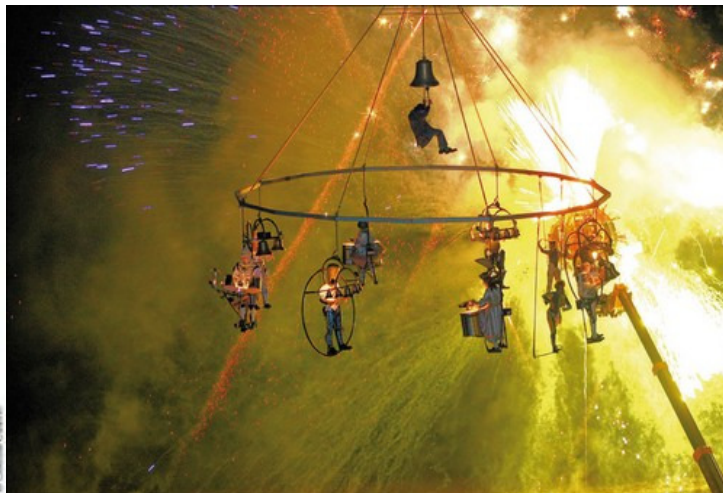
«Неустовые звонари» театра Transe Express

Создатели «небесного искусства», как называют себя основатели театра, Брижит Бурден и Жиль Род, вдохновлялись мобильными кинетическими конструкциями американского скульптора Александра Колдера. Театр Transe Express существует 20 лет, и использует самые разные техники: танец, акробатику, цирковое искусство, огненное шоу.