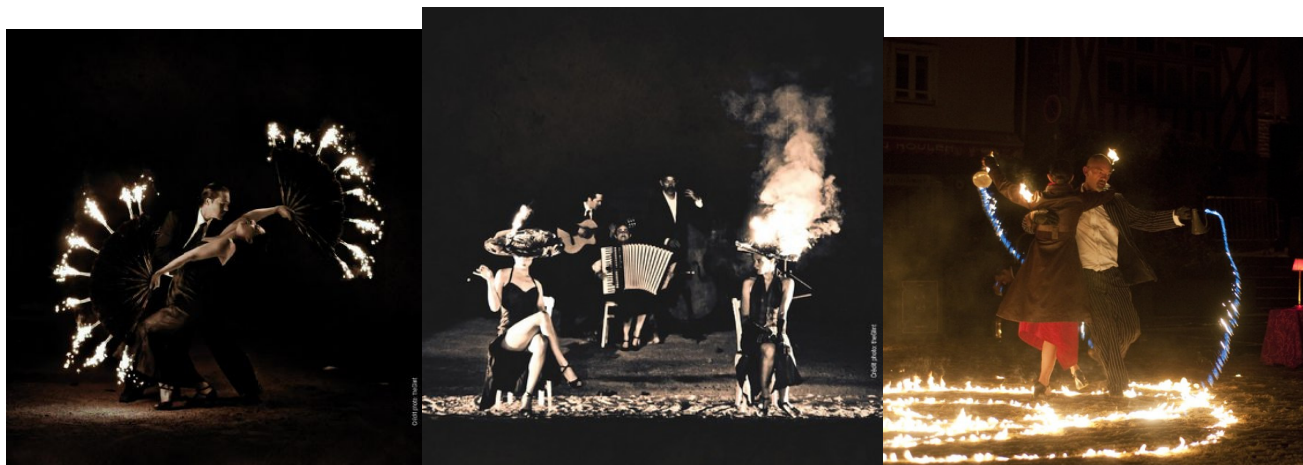
« Polar» - в исполнении актеров труппы Bilbobasso танго в самом деле огненное.

Здесь, конечно, интересна не сама трэшевая стихия кабаре, и не наивная стилизация под немое кино, а то, как блестяще выявлена в спектакле драматургическая сила огня.