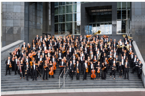
Orchestre de l'Opéra national de Paris 16/17