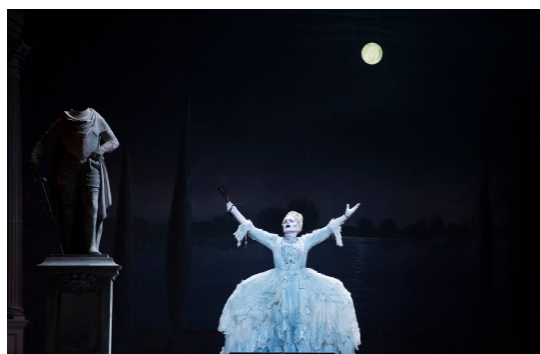
Les Contes d'Hoffmann 16/17