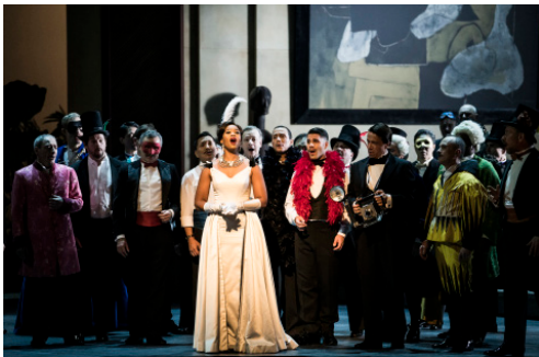
Manon 19/20

Jusqu'au 22 mars 2020 - uniquement en France