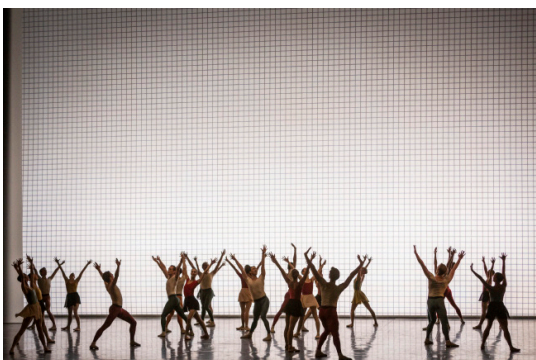
Glass Pieces - J. Robbins

Fancy Free, A Suite of Dances, Afternoon of a Faun, Glass Pieces