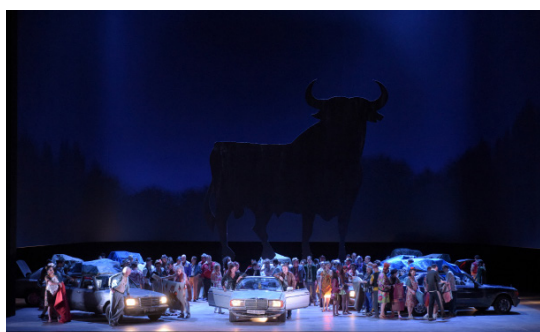
Carmen 16/17