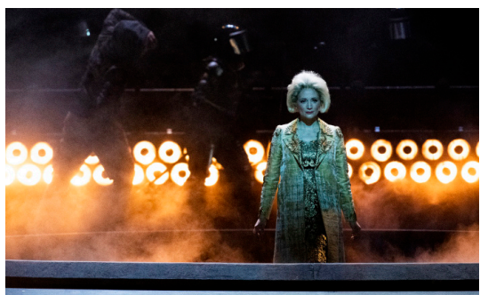
Les Indes galantes 19/20

Jusqu'au 9 octobre 2020 - sur operadeparis.fr et arte.tv