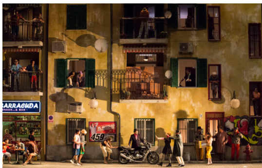
Le Barbier de Séville 14/15