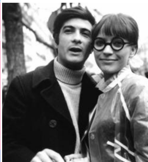
Анна Карина и Жан-Клод Бриали в фильме «Анна» (1967). фильма).