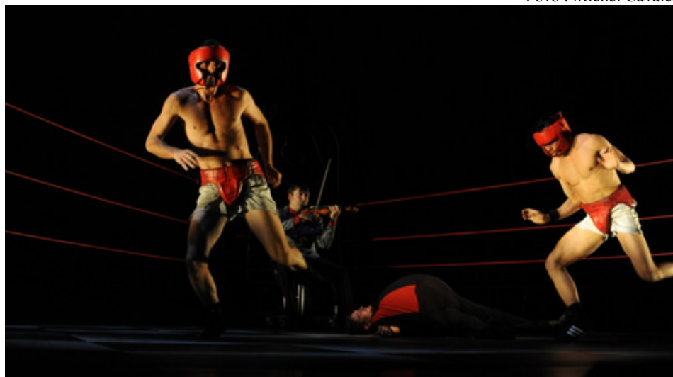
Сцена из пьесы «Бокс Бокс»