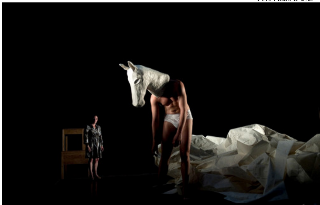
Фрагмент пьесы «Мазут»

Премьерную пьесу исполнили четыре танцовщика, включая Шарифи: они пластически воплощали серьезные идеи жестокого подавления свобод человека в современном обществе. Находясь под постоянным психологическим гнетом, участники сценического действия собирались в группы и разбредались, занимались самобичеванием, устраивали протесты и даже гибли. За полтора часа исполнители пьесы так намучались и так много всего наломали, что, как сказал Монтанари, «на сцене получился замечательный беспорядок». В