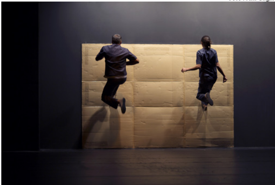
Фрагмент пьесы «Eskiyeñi»

В новой постановке под звучание непонятного текста артисты, главным образом, параллельно двигаются и одержимо прыгают на стену, стараясь пересмотреть свои первые эксперименты, которые осуществили в трех ранних пьесах, созданных в 1996-99 годы. Эти пьесы базируются на физических указаниях, которые четко объясняют, что нужно делать, чтобы тело двигалось без выражения чувства. Стремление хореографов использовать свои прошлые