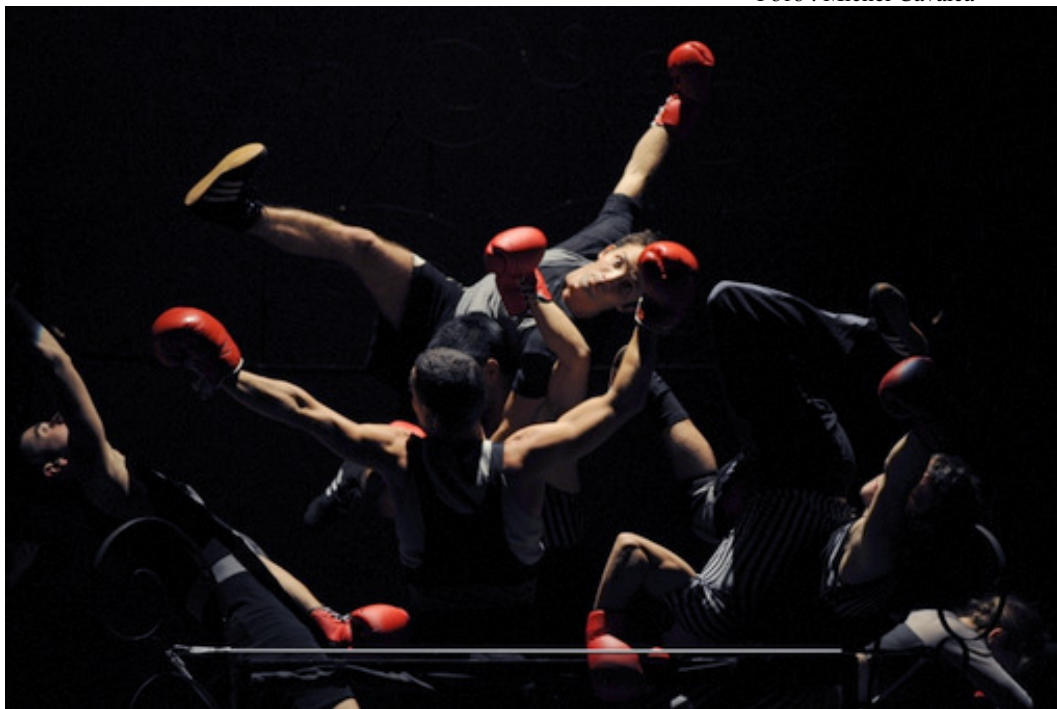
Сцена из пьесы «Бокс Бокс»

Родившийся в Лионе в 1973 году, Мурад занимается танцем хип-хоп с 15-летнего возраста. В 1989 году он создал свою первую труппу, в 1996 году - вторую труппу; в 2004 году получил офицерский орден Искусств и литературы; с 2009 года является руководителем Национального хореографического центра в Крете, под Парижем (CCN Créteil). Автор 15-и постановок, Мурад уже восьмой раз участвует в Montpellier Danse. В нынешнем сезоне он стал хореографом-резидентом фестиваля и получил привилегию показать сразу три свои постановки: две премьерные - «Yo Gree Ti», «Kafig Brasil», и «Boxe Boxe».