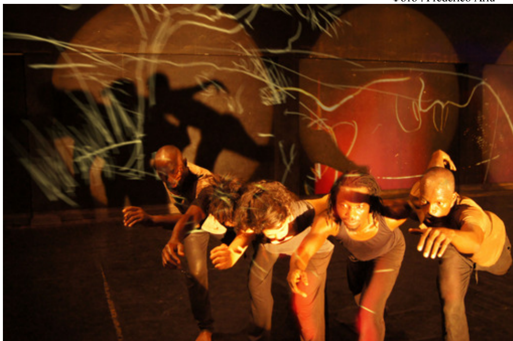
Сцена из пьесы «По ту сторону границ»